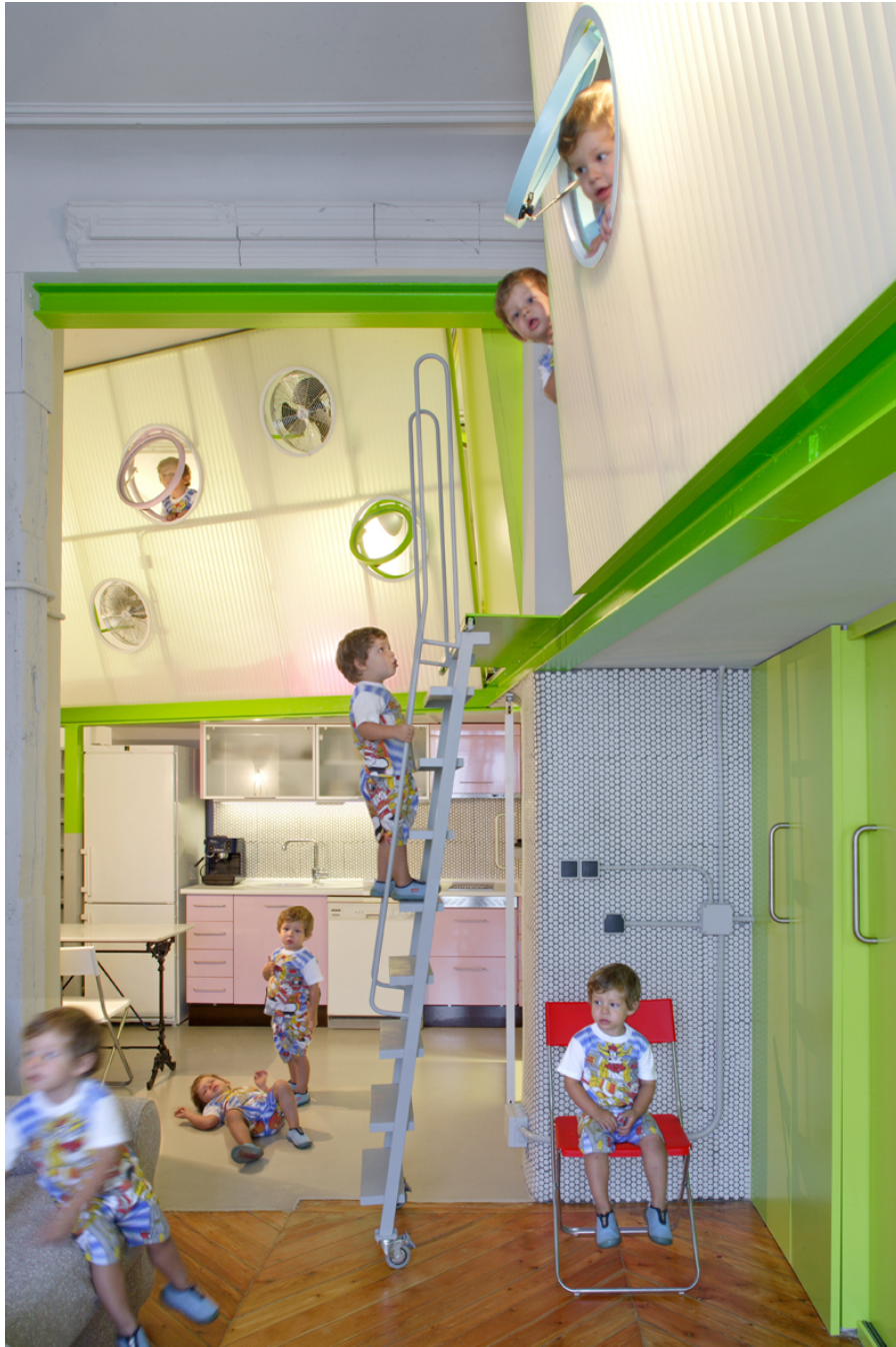
07. Andrés Jaque / Office for Political Innovation. TUPPER HOME.