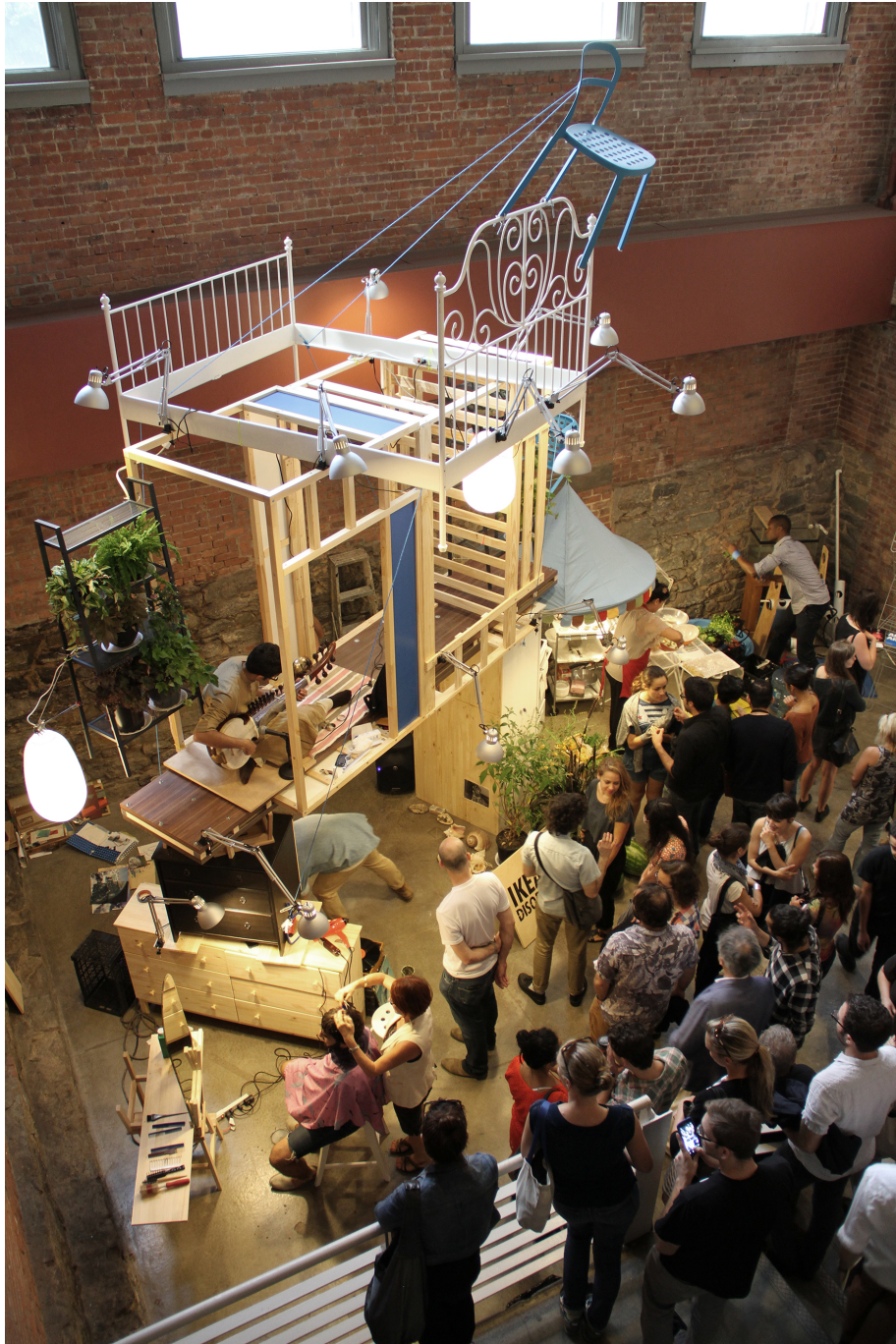
05. Andrés Jaque / Office for Political Innovation. IKEA Disobedients. MoMA, Nueva York. 2012.