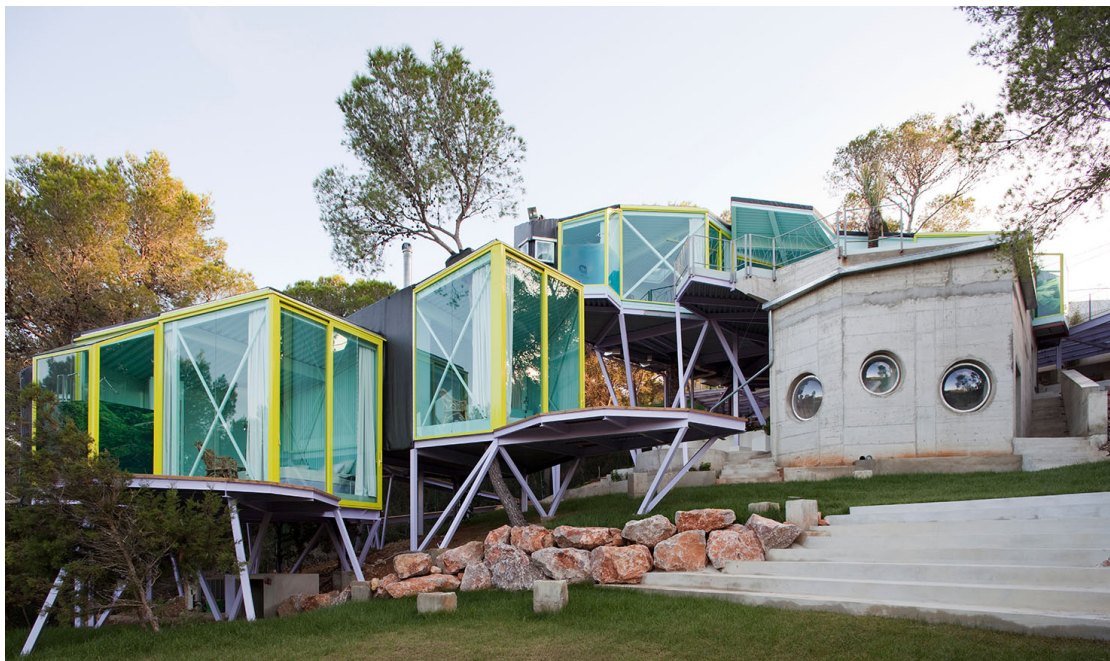
10. Andrés Jaque / Office for Political Innovation. Casa en Never Never Land. Ibiza.

Todos estos trabajos pretenden ofrecer una constelación de experiencias que, en su conjunto, plantean estrategias intervenir, por medio de prácticas arquitectónicas, en la manera en que las proyecciones se acoplan con las performances de lo doméstico. Porque en definitiva, la casa no es un objeto, sino un proceso en el que las asociaciones cotidianas se discuten, se ensayan y se reorganizan. Está construida con artefactos materiales, pero también con ideas, deseos, controversias y afectos. La arquitectura doméstica es al mismo tiempo grande y pequeña. Pequeña porque contribuye a definir cómo se dan las micro relaciones cotidianas. Pero al mismo tiempo grande porque sumadas estas realidades terminan generando efectos a una escala planetaria. La