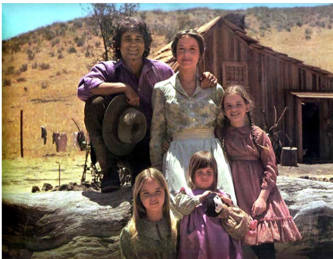
01. Los Ingles en 'La casa de la pradera'. NBC, 1974.

La incorporación de lo doméstico a los debates generales que afectan a la arquitectura y al urbanismo tiende a estar basada en asunciones equivocadas. De manera habitual se diseñan y se discuten las casas pensando en formas de vida que no existen. Por este motivo, y por muchas otras cosas, lo doméstico se da, en la mayoría de los casos, como una contra-arquitectura, es decir, como una práctica de subversión por medio del uso de los dispositivos que fueron diseñados atendiendo presupuestos que rara vez llegan a cumplirse. Este desfase entre los enunciados y las trayectorias es el campo en el que se están dando experimentos colectivos, como por ejemplo las viviendas compartidas por señoras mayores y estudiantes o como las casas-escuela de trabajadores transnacionales, como los centros autogestionados de empoderamiento en cuestiones de género o como las casas desocupadas convertidas en reservas medioambientales, que contienen un gran potencial para repensar la relación entre arquitectura y domesticidad.