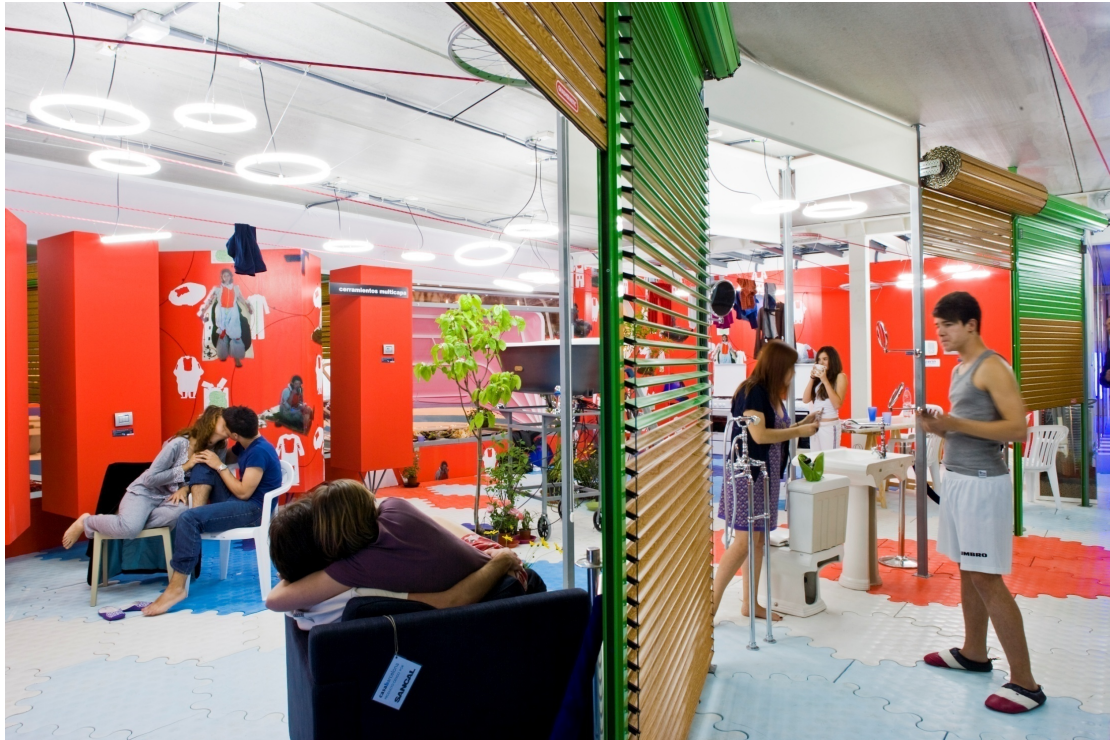
09. Andrés Jaque / Office for Political Innovation. Rolling House for the Rolling Society.