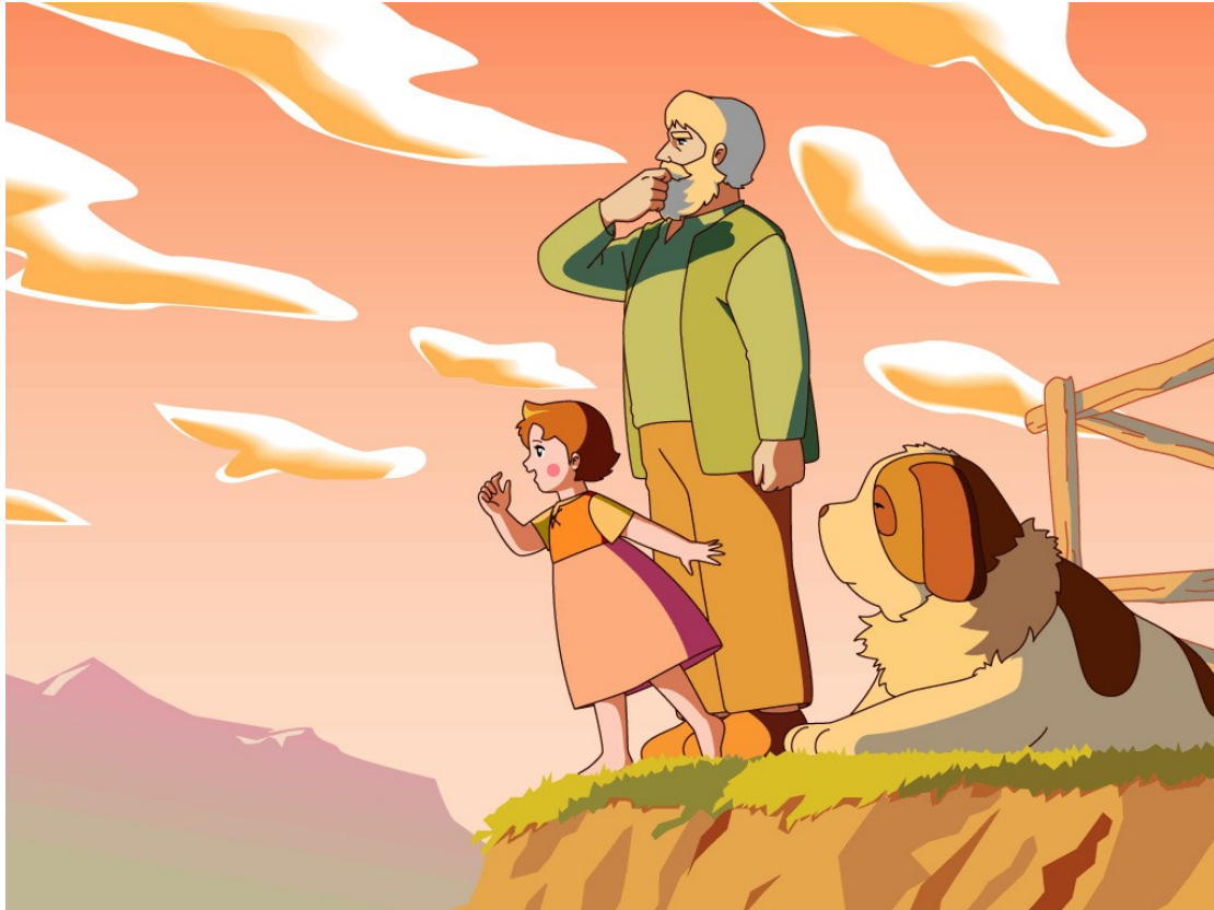
02. 'Heidi, la niña de los Alpes', Zuiyo Enterprises 1974.

1974 es también el año en que los estudios japoneses Zuiyo Enterprises distribuyeron por primera vez la serie de dibujos animados ' Heidi, la niña de los Alpes ', basada en las diferentes novelas que Johanna Spyri dedicó al personaje de Adelaida, una niña huérfana a quién su tía Dete lleva a vivir con su abuelo, un viejo gruñón retirado de la interacción social en una cabaña en un valle de los Alpes. Pese a ser una familia un tanto rara, la que el abuelo forma con Adelaida y el perro Niebla, la serie mantiene intacta la idea de que el hábitat de lo familiar es el dispositivo arquitectónico único de la casa, pero este segundo producto de ficción televisiva refuerza una segunda idea: la casa como espacio de desconexión de lo social. En la reclusión en la cabaña de los Alpes, el abuelo ha encontrado la posibilidad de eludir el contacto con sus congéneres a los que desprecia. Tanto él como Heidi utilizan la cabaña y sus alrededores como un lugar donde las convenciones sociales no tienen aplicación. Él, por ejemplo, nunca se esfuerza por ser amable con las pocas personas que le visitan, de la misma manera que a Heidi no le preocupa retozar por los prados en ropa interior mientras juega con Niebla. Las retóricas televisivas tienden a presentar lo doméstico como el lugar en el que los humanos se desconectan de lo social.