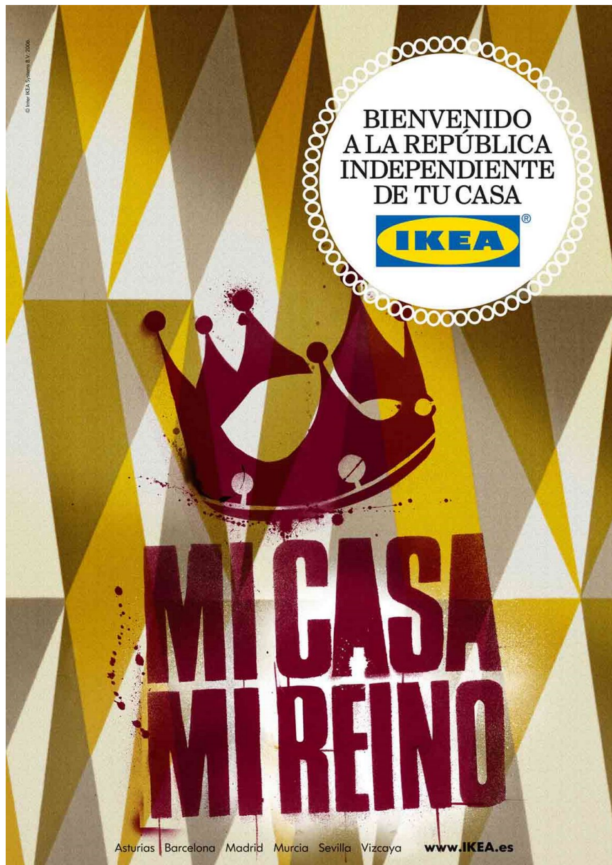
03. Ikea. Catálogo en España. 2007.

Por último 1974 es también el año en el que Ikea, sin lugar a dudas el mayor operador arquitectónico mundial en estos momentos, abrió su primera tienda en Tokio, y con ella inició una expansión global que ha hecho que en 2012 su catálogo tuviese tiradas mayores a las de la Biblia y en un número mayor de idiomas. 3 Estos tres acontecimientos están conectados en su uso de narrativas que liberan al tiempo que bloquean opciones en el diseño y producción de domesticidad. En 2007 la agencia de publicidad de Barcelona SCPF desarrolló para Ikea la campaña “Bienvenido a la república independiente de tu casa” con la que inundó el espacio público, la televisión y las publicaciones de buena parte de los 43 países en los que opera. En las imágenes de la campaña un gran número de familias sanas y jóvenes celebraban la independencia política que sus interiores domésticos (repúblicas independientes) les ofrecían. Se quitaban por fin los tacones, dormían fuera de horas, se atrincheraban con una manta, alargaban más de la cuenta un baño relajante con espuma, se agrupaban para ver el