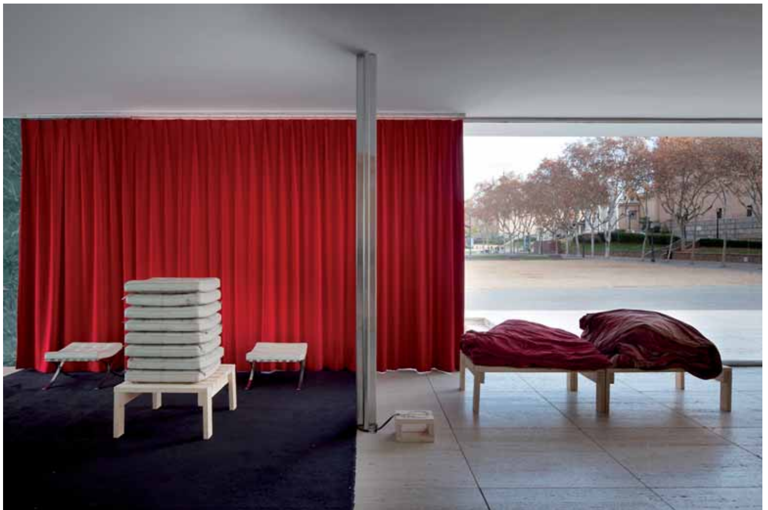
5, 6 Andrés Jaque: Přízrak. Mies jako rendrovaná společnost ; instalace.